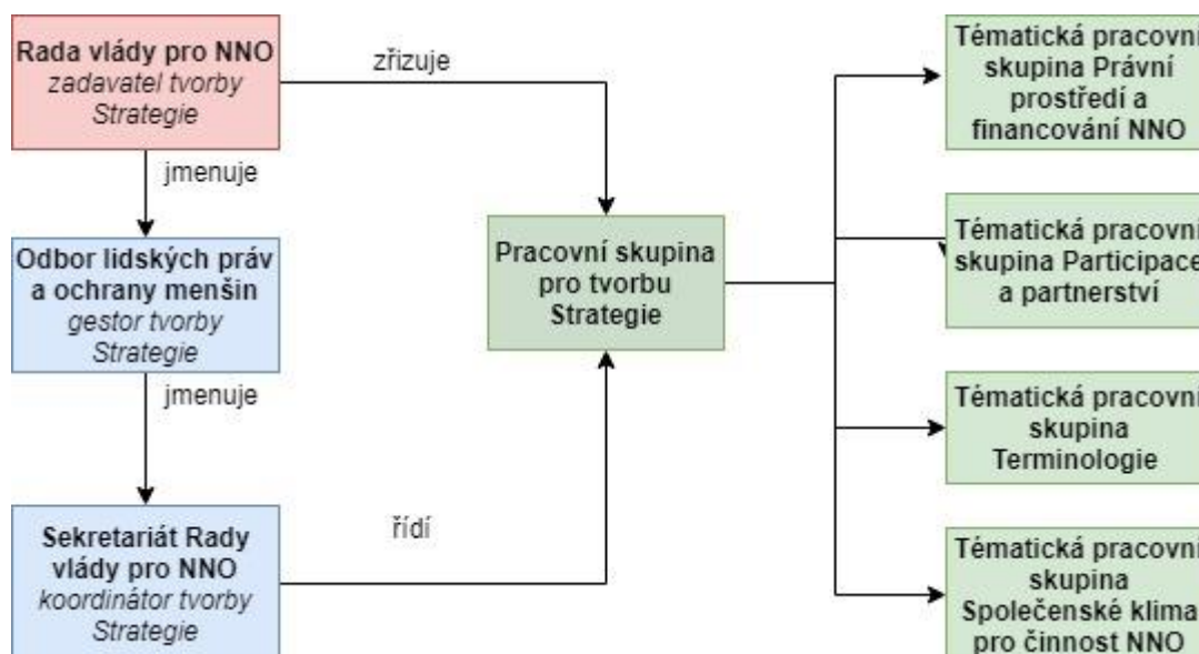
Obr. 1: Grafické schéma organizační struktury

Gestorem Strategie je Odbor lidských práv a ochrany menšin, Úřadu vlády České republiky, který zaštiťuje roli koordinátora pro tvorbu, realizaci a naplňování cílů Strategie, dále samostatně implementuje konkrétní opatření plynoucí ze Strategie a provádí průběžné a závěrečné vyhodnocení Strategie. Koordinátorem tvorby a následné implementace a vyhodnocení Strategie je sekretariát RVNNO, který je organizačně zařazen pod Odbor lidských práv a ochrany menšin. Tajemnice RVNNO organizuje a řídí práci týmu, komunikuje stav tvorby a implementace Strategie na PS Strategie, v úkonech RVNNO a zasedání samotné RVNNO.